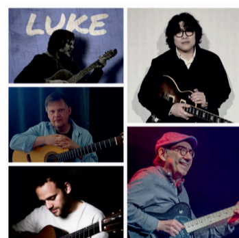
© Fritz-Busch-Musikschule/ Courtesy The Artists; Mario Mammone (u. r.); © Irina Misal; Honggyu Lee (o. r.); © Jiho Park, Sangjun Kim

Sa 04.07., 19.00 Uhr Konzert: Gitarre pur