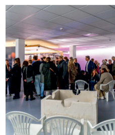
Vernissage (2025)

In einer öffentlichen Führung gibt Jennifer Cierlitz, Künstlerische Leiterin des Kunstvereins Siegen, Einblicke in die Ausstellung und stellt zentrale Arbeiten sowie die konzeptionellen Hintergründe des Projekts vor.