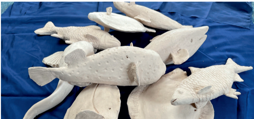
Foto: Petra Oberhäuser: Forellenhoch, Makrelenlachs und Heringsscholle © Petra Oberhäuser

Mit ihrer Jahresausstellung „neu 3 “ zeigen die ASK-Mitglieder aktuelle Arbeiten frisch aus den Ateliers. Ebenfalls neu vorgestellt werden die Kalenderedition 2027 sowie die Jahresmappe mit 12 Originalgrafiken.