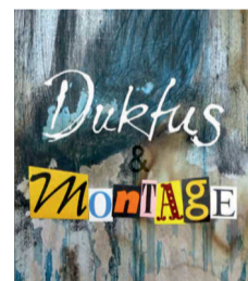
Plakatmotiv Duktus & Montage (Design Michael G. Müller/artmill) © KulturSiegen

Interessierte Besucherinnen und Besucher sind eingeladen, spontan Fragen zu stellen und mit Decker & Müller über ihre Eindrücke zur Ausstellung zu sprechen.