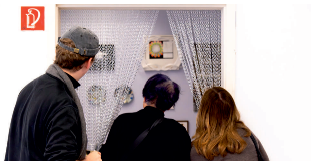
Showroom Galerie Haus Seel