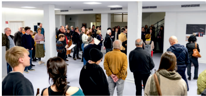
Veranstaltung in der Galerie Haus Seel