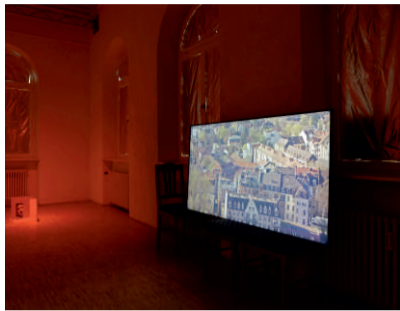
Matt Welch: Untitled (Schwarzwaldhof), 2023