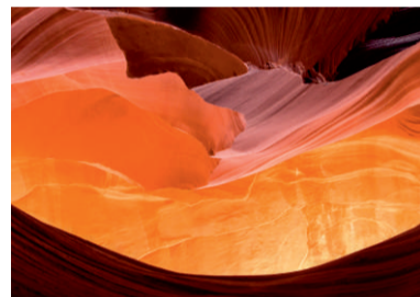
Antelope Canyon, Arizona

Christian Scheerer, Zweiter Vorsitzender des Fotokreises Siegen und Fotograf mit Schwerpunkt Landschaftsfotografie, präsentiert die spektakulären Naturschönheiten amerikanischer Nationalparks in Arizona, Nevada und Utah.