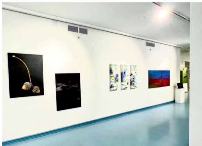
Traditionell zu Gast im Haus Seel: ASK-Ausstellung

Im Rahmen der ASK Ausstellung „es war – es ist – es wird sein“ wird unter der Überschrift „Tradition – Überlebt? Eine Kraftquelle?“ ein Impulsvortrag im Hinblick auf unseren Umgang mit den Zeitumständen stattfinden. In lockerer abendlicher Gesprächsrunde ergehen Anstöße zum Nachdenken und Einordnen.