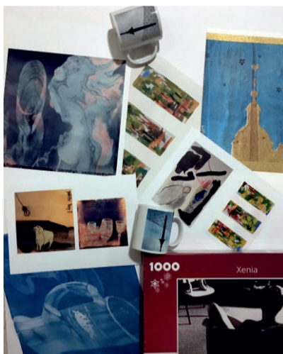
Kleinformatige Kunst von ASK-Mitgliedern

Eröffnung: Do (Christi Himmelfahrt) 19.00 Uhr