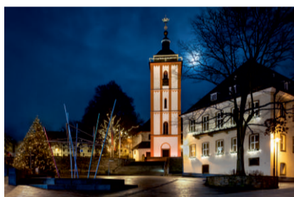
Foto: Marktplatz und Rathaus im Lichterglanz

Der Fotokreis Siegen feiert – und das gleich zweimal: zum einen den 75. Jahrestag seiner Gründung, zum anderen das große Stadtjubiläum 800 Jahre Siegen. Die Mitgliederausstellung steht daher im Zeichen von Siegen mit Ansichten der Stadt. Im Untergeschoss der Galerie werden anlässlich des Vereinsjubiläums Reise-, Architektur-, Tier- und Sportfotos gezeigt.