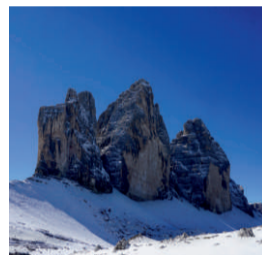
Drei Zinnen

Südtirol – Fotoreise in eine faszinierende Bergwelt