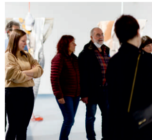
Gang durch die Ausstellung, Foto: Christian Diehl © Kunstverein Siegen e. V.

Mo 10.04., 16.00 Uhr Kunstverein Siegen - Finissage Mitgliederausstellung